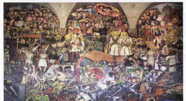
Diego Rivera. Mural sobre Emiliano Zapata (1935).