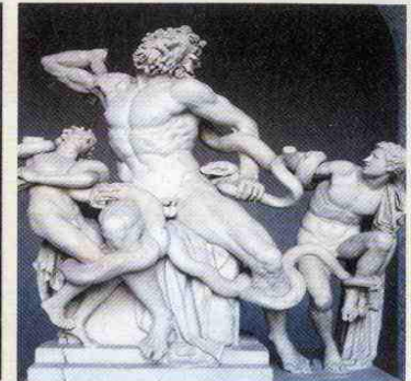
Laocoonte y sus hijos. Praxíteles. Arte helenístico. Siglo II a. C.