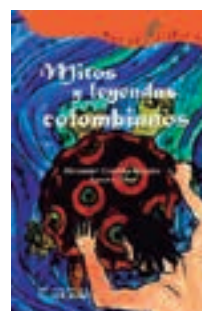
Mitos y leyendas colombianas. Alexander Castillo Editorial: Educar