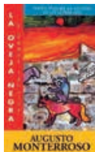
La oveja negra y las demás fábulas. Monterroso Augusto Editorial: Alfaguara